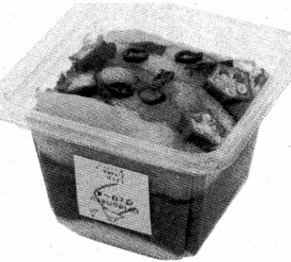
「とよみつひめ」とトリュフソースのサラダ(ソースは別添)、(下)1富士2鷹3折戸なすヴェリーヌ